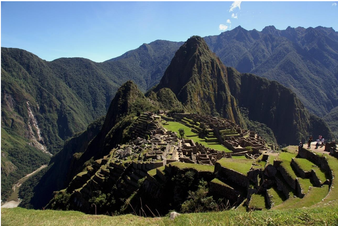
Figura 3. Machu Picchu.

Machu Picchu no Vale Sagrado dos Incas. (Figura 4).