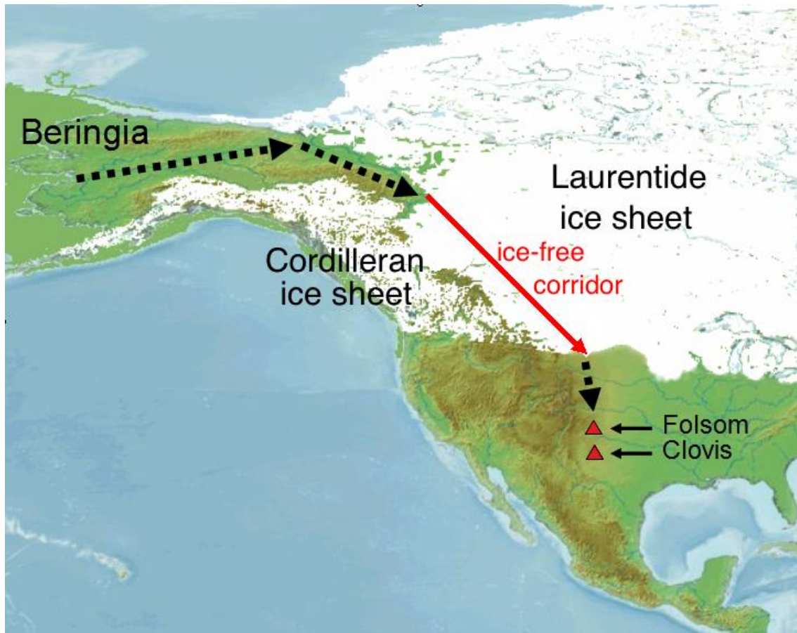
Figura 1. Estreito de Bering.