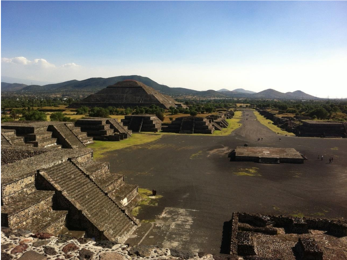
Figura 3. Tenochtitlán.