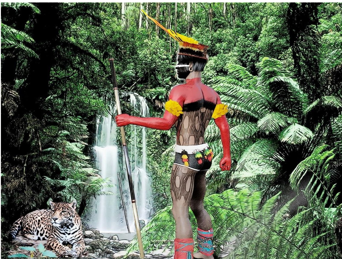
Figura 3. Nativo Xingu.

Representação ilustratória de um nativo Xingu. (Figura 3).