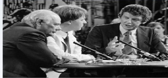
Imagem: National Archief / Aneto / Croes / The use of this image is free for any purpose